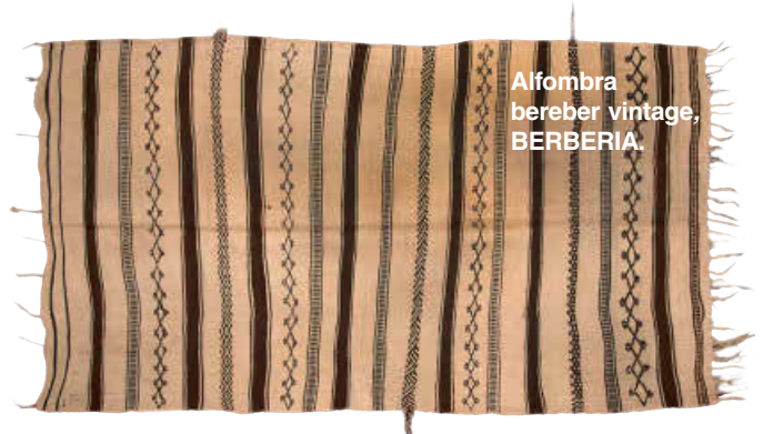
Alfombra bereber vintage, BERBERIA.

"El coral o las conchas siempre cuelgan de mi cuello, es la única forma que tengo de llevar un trocito de mar conmigo"