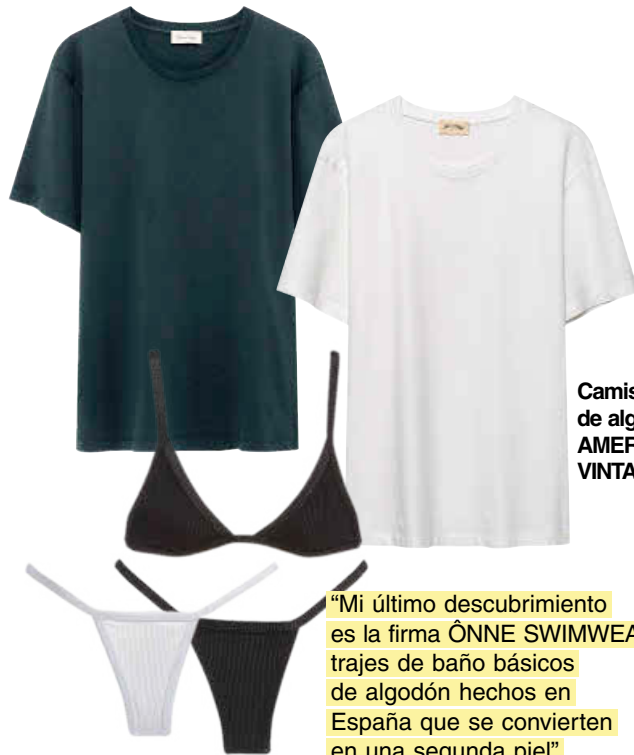
Camisetas de algodón, AMERICAN VINTAGE .