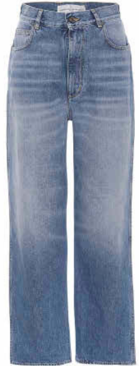
Pantalón vaquero oversize , GOLDEN GOOSE para Mytheresa.com