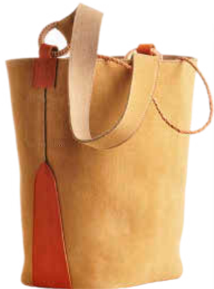
Bolso saco de ante, ALUMBRA.

"Para mí el verano es desconexión, no hay horarios ni agenda, sólo mar, un pareo, dos camisetas y alguna historia surrealista que recordar en invierno".