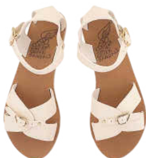
Sandalias de piel, ANCIENT GREEK SANDALS.

"El coral o las conchas siempre cuelgan de mi cuello, es la única forma que tengo de llevar un trocito de mar conmigo"