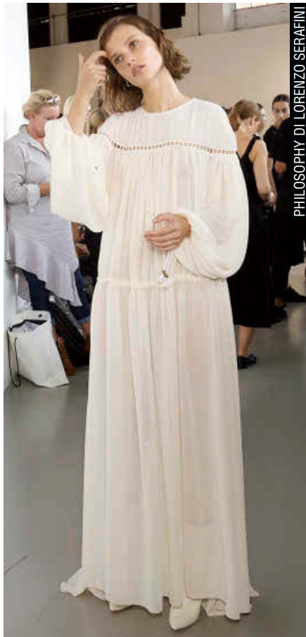
PHILOSOPHY DI LORENZO SERAFINI